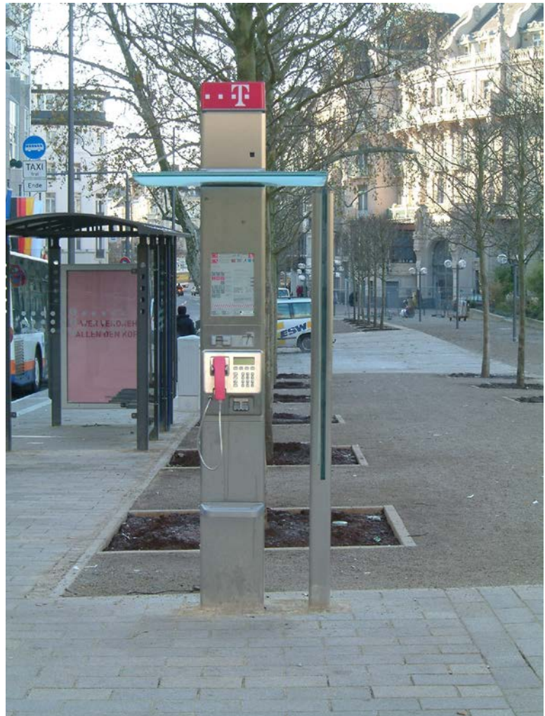
positives Beispiel für öffentliche Fernsprecher

Gestalterisch problematisch ist die Aufstellung mehrerer, gestalterisch unterschiedlicher Einrichtungen von einem Anbieter, bzw. von mehreren Anbietern.