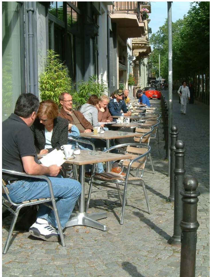
positives Beispiel für Gastronomiemöblierung

Die Beschränkung der Fläche für Außenbestuhlung auf die Gebäudebreite soll einen Beitrag zur Wahrnehmbarkeit der Haus-, bzw. Stadtstruktur leisten, wobei in besonderen räumlichen Situationen Ausnahmen möglich sind.