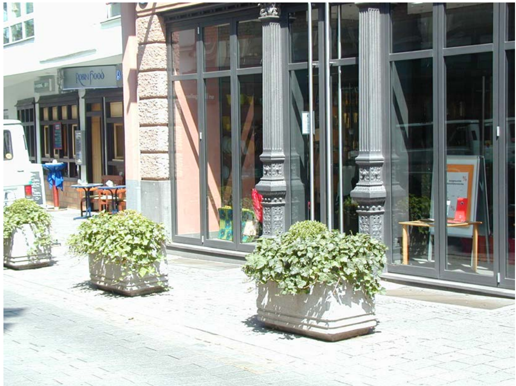
positives Beispiel für Begrünungselemente

Begrünungselemente dienen der Auflockerung des Straßenbildes und sind in Maßen grundsätzlich erwünscht. Problematisch werden sie dann, wenn Sie als Einfriedung, bzw. „Vorgarten“ verwendet werden oder bei gehäuftem oder überdimensioniertem Auftreten.