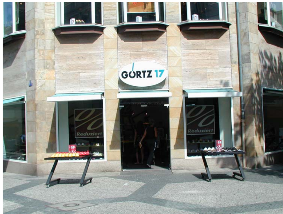
positives Beispiel für Warenauslagen

Durch die Regelung der Flächeninanspruchnahme soll gewährleistet werden, dass alle Geschäfte dieses Recht in Anspruch nehmen können, ohne dass die Warenauslagen ausufernd, bzw. nahtlos ineinander übergehen. Sie sollten nicht durch ihre bloße Menge die stadtgestalterische Qualität überdecken und zum stadtraumprägenden Element werden.