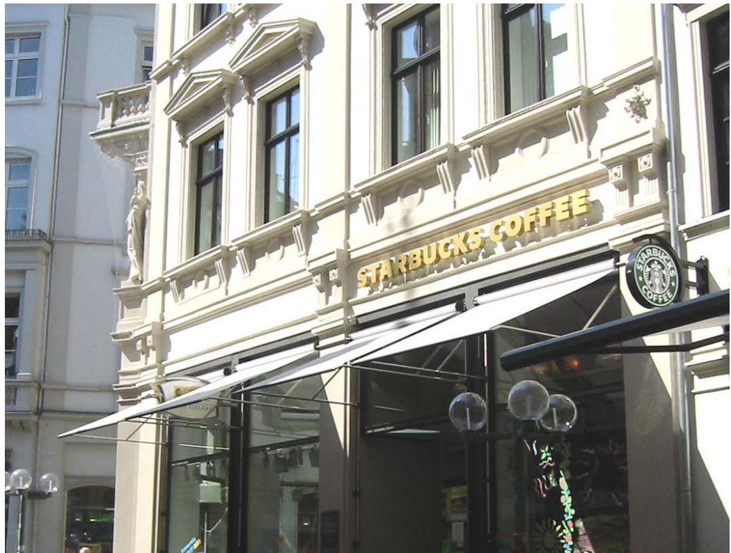
positives Beispiel für Markisen

Der Ausschluss greller Farben und die Beschränkung der Breiten- und Tiefenausdehnung von Markisen zielt auf eine dezente Erscheinung, die eine deutliche Präsenz ermöglicht ohne in Konkurrenz zu den vielfach historischen Gebäudefassaden zu treten.