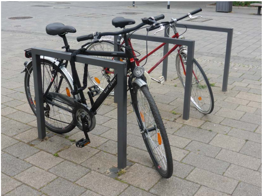
positives Beispiel für Fahrradständer

Eine Vereinheitlichung bezüglich Form und Farbe der privaten Fahrradständer dient der gestalterischen Qualitätssicherung und der optischen Ruhe im Straßenbild.