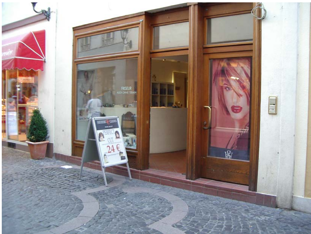
positives Beispiel für die Anordnung von Werbeständern

Die Festlegungen beziehen sich daher auf Anzahl, Ort und Art der Werbeständer. Ziel ist es, die Menge zu reduzieren und durch klare Begrenzungen der Größe der Vielgestaltigkeit Grenzen zu setzen. Die direkte räumliche Zuordnung der Werbeständer zu einem Betrieb dient der Ordnung im Straßenraum und erleichtert dem Passanten die Zuordnung der Werbebotschaft zum Betrieb und dient somit dazu, die Betriebsidentität zu stärken.